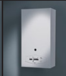
Badgeiser met Denkvlam